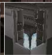
Hidden drainage system water being flowed into post